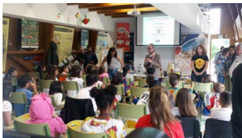
Investigadoras do campus participaron nunha sesión divulgativa na Aula da Natureza da Oira.

A Aula da Natureza de Oira acolleu este mércores unha actividade didáctica destinada a nenos e nenas sobre a avespá velutina. Nela, investigadoras do campus de Ourense compartiron cos cativos e cativas unha sesión na que tiveron a oportunidade de explicarlle as características desta especie e dos seus niños e incluso como actuar ante a súa presenza. +Info.