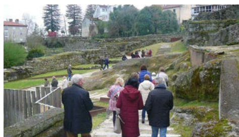
Unha visita das aulas sénior esta primavera a San Cibrao e Ribadavia.