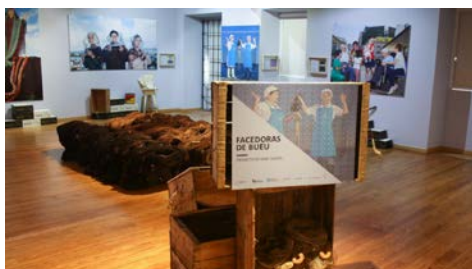
A exposición Facedoras de Bueu pode visitarse no Museo Massó.

300 persoas, das que 19 son galegas, elixidas de entre case 2000 candidatas e candidatos de toda España, participarán o vindeiro venres 6 de xullo en Madrid no I Cumio de Innovación Tecnoloxía e Economía Circular, organizado pola Advanced Leadership Foundation , e no que, catro premios Nobel e outros líderes nacionais e internacionais, formarán ás persoas seleccionadas, tanto en innovación tecnolóxica, como en economía circular. +Info.