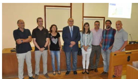
O persoal investigador do proxecto co reitor.