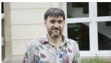
Os afloramentos costeiros están a actuar como un moderador do quecemento global.

14 estudantes que presentan os seus traballos de doutoramento e 21 sénior, dos que nove son da Universidade de Vigo, que discutirán esas investigacións, participarán entre este martes 10 de xullo e o vindeiro xoves no XXIII Workshop on Dynamic Macroeconomics , que se celebrará no castelo de Soutomaior. Organizado polo grupo de investigación Research Group of Economic Analysis (RGEA) da Universidade de Vigo e coa colaboración de docentes doutras universidades e centros de investigación internacionais +Info.