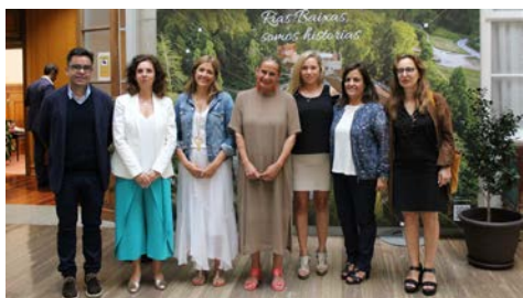
Imaxe do encontro.