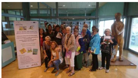
Fotografía de familia das participantes na visita.