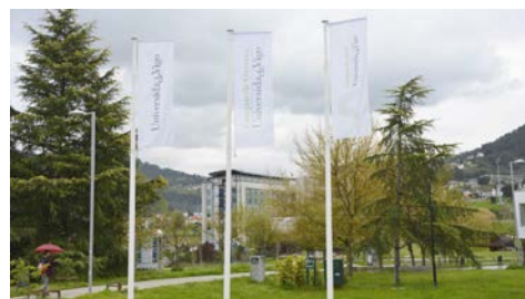
A convocatoria de axudas Inou destina 40.425 á realización de novos proxectos feitos no campus

Crear un sistema europeo de xestión de infraestruturas capaz de deseñar, validar e establecer métodos, estratexias, ferramentas e intervencións técnicas para aumentar de xeito significativo a resistencia e a seguridade da rede de estradas e de infraestruturas ferroviarias ante circunstancias adversas ou eventos extremos, desde inundacións ata secas, incendios forestais, terremotos ou correntamentos de terra. Este é o gran obxectivo de Safeway , o primeiro proxecto europeo da convocatoria H2020 liderado pola Universidade de Vigo e no que se aglutina a 15 socios de sete países. +Info