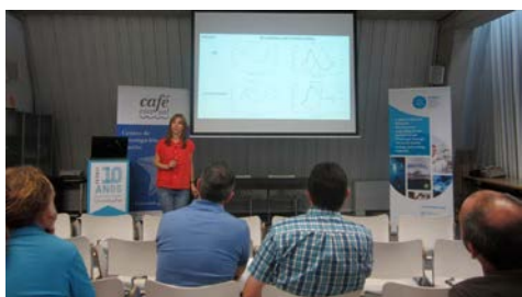
O reloxo biolóxico do rodaballo centro o último Café con Sal deste curso.